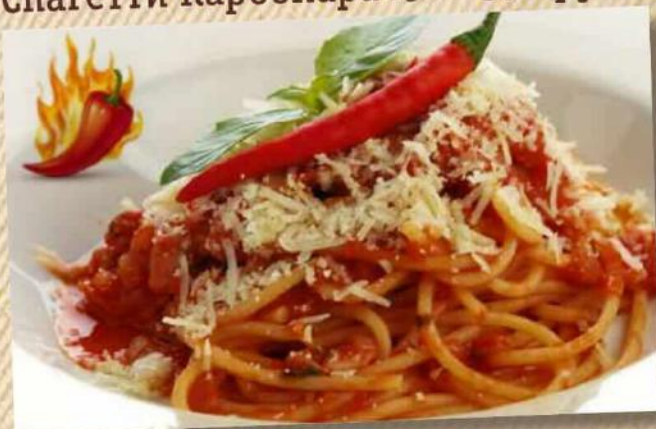
Спагетти Амаричана 280 г 350 руб.