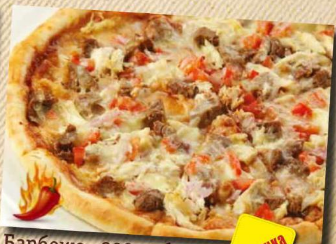
Барбекю 390 руб. Говядина, курица, лук, помидоры, сыр, соус томатный, соус барбекю. 450 г