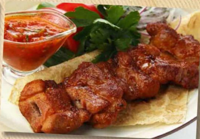
Шашлык из свинины 480 руб. Свинина, лаваш, овощи, маринованный лук, соус «Сацибели». 180/150/50 г