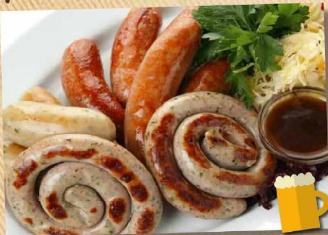
Расколбас 1800 руб. Ассорти колбас: из говядины и свинины с картофельным пюре и квашеной капустой. 680/250/60 г