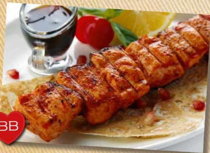
Шашлык из семги 890 руб. Филе семги с соусом «Наршараб». 170/65/40 г