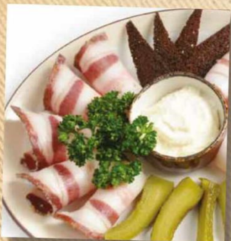
Домашнее сало 260 руб. Деревенское сало, хрен, ржаные тосты 75/40 г