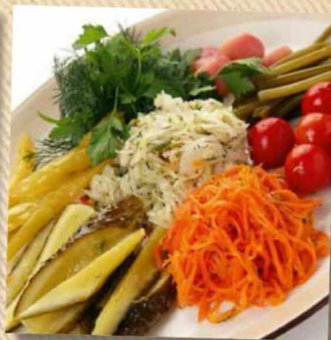
Соленья бочковые 230 руб. Огурцы, томаты, капуста квашеная, черемша, чеснок, морковь острая. 300 г