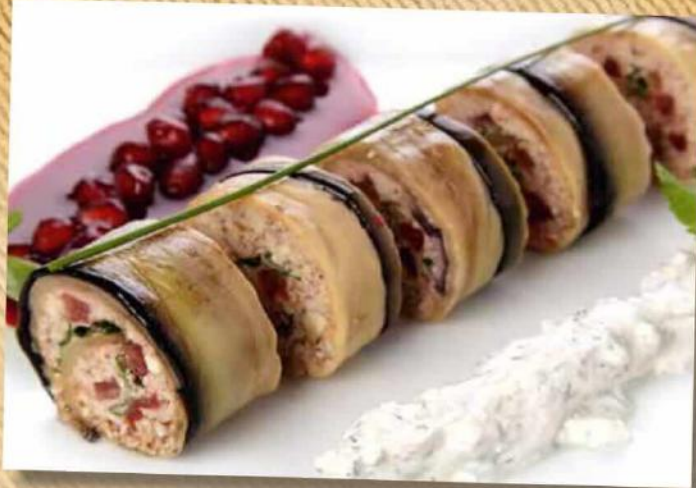
Рулетики из баклажанов 340 руб. Руллет из баклажана со сливочно-ореховой начинкой. 150/30/40 г