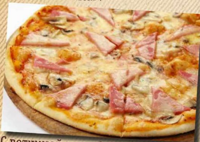
С ветчиной и грибами 320 руб. Ветчина, грибы, томатный соус, сыр. 400 г