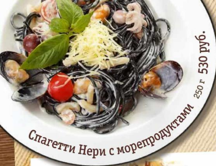
Спагетти Нери с морепродуктами 250 г 530 руб.