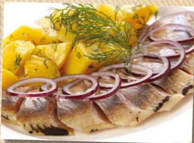
Сельдь с картофелем 310 руб. Филе сельди с горячим картофелем и крымским луком. 100/100/30 г