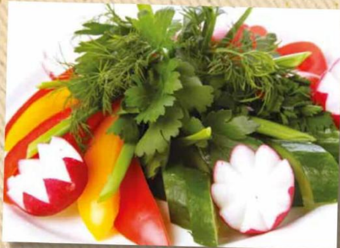
Овощи свежие с зеленью 300 руб. Букет из свежих овощей с зеленью. 300 г