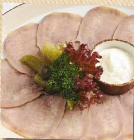
Телячий язык с корнишонами и хреном 390 руб. Отварной телячий язык, маринованные огурцы, хрен. 100/35/30 г