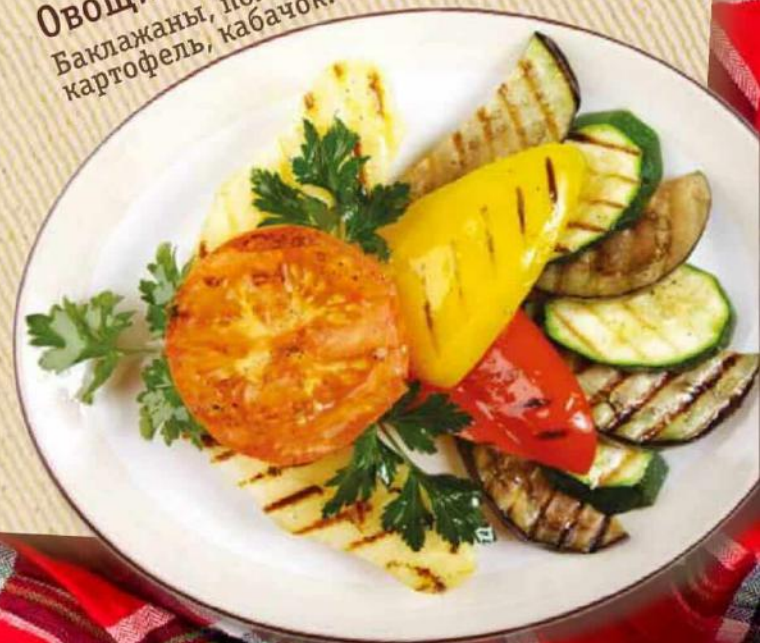
Овощи гриль 260 руб. Баклажаны, помидор, перец, картофель, кабачок. 250 г