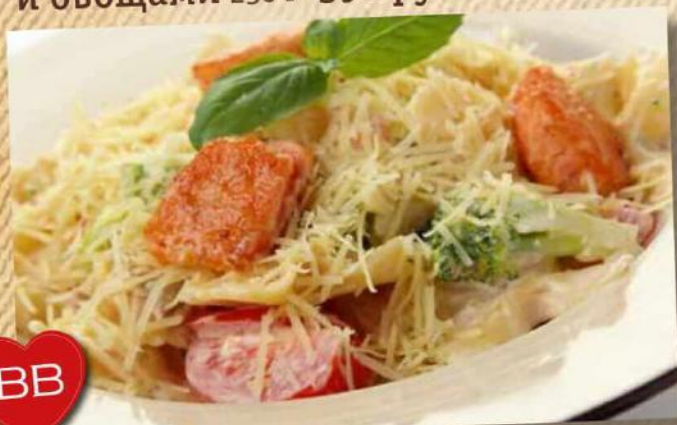
Фарфале с лососем и свежими томатами 300 г 550 руб.