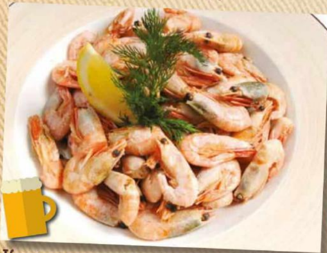
Креветки пивные 550 руб. На Ваш выбор: отваренные в пиве с травами или жареные с чесноком и соусом «Коктейль». 200/40 г