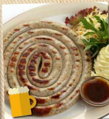
Гигант 1250 руб. из свинины 400/150/100/30 г