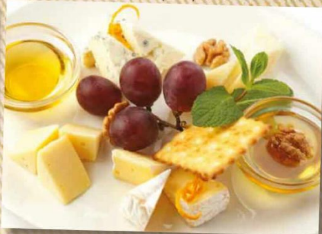
Ассорти сыров 490 руб. Ассорти сыров: Камамбер, Пармезан, Дор-блю, Мааздам с медом, виноградом и грецким орехом. 100/50/30/10 г