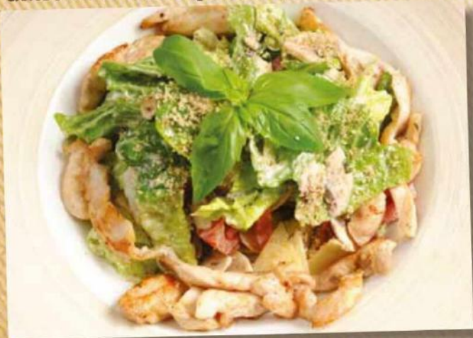
Денвер 370 руб. Отборное куриное филе с овощами, сыром и соусом «Лионез». 265 г