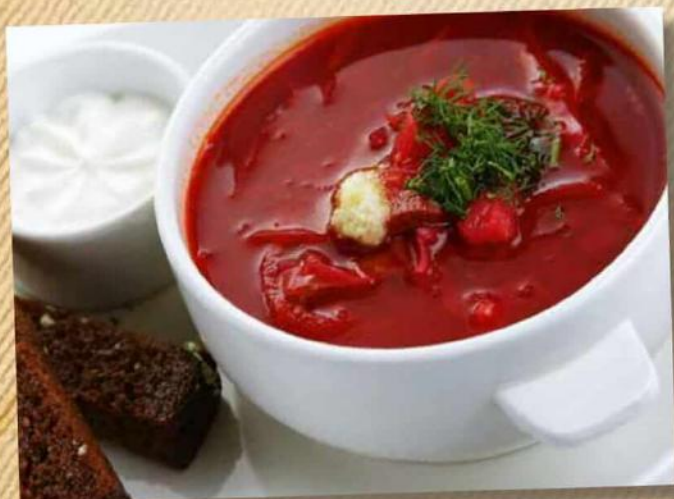
Борщ со сметаной и чесночной гренкой 290 руб. 300/30 г