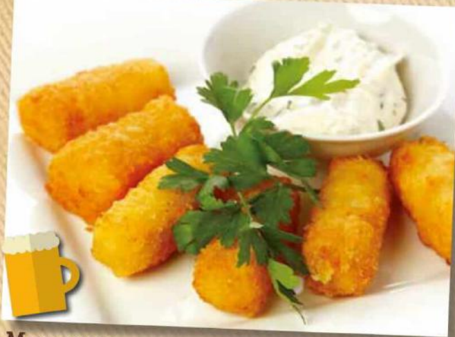
Моцарелла в сухарях 150/50 г 250 руб.