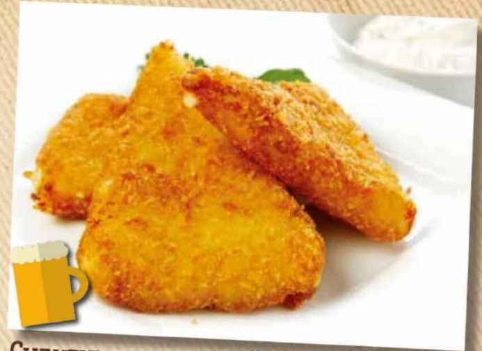
Сулугуни, жареный в сухарях 150/50 г 230 руб.