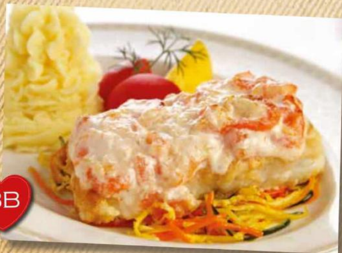
Филе судака запеченое под креветочным соусом 540 руб.