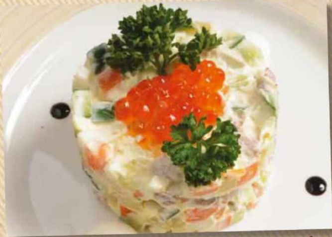
Оливье с говядиной 250 г 350 руб.