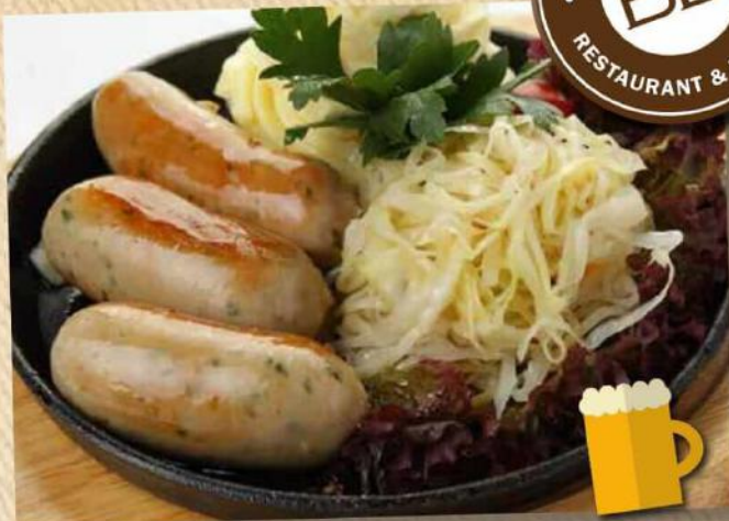
Мюнхенские 520 руб. из свинины 160/150/100/30 г