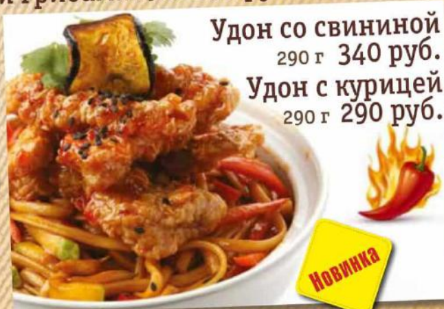
Удон со свининой 290 г 340 руб. Удон с курицей 290 г 290 руб.