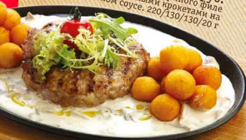
Стейк рубленый из телятины 690 руб. Стейк из телятины и куриного филе с сыром, с картофельными крокетами на сливочно-грибном соусе. 220/130/130/20 г