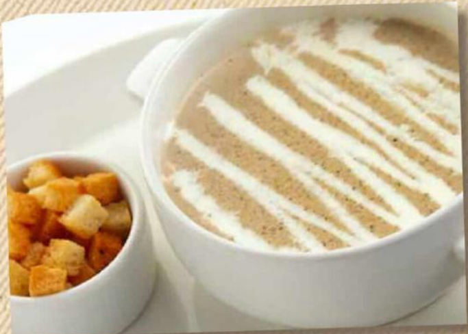
Крем-суп из белых грибов 240 руб. 250/10 г