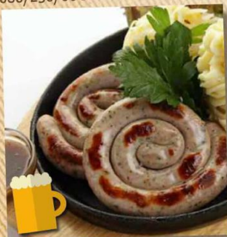
Баварские 520 руб. из свинины 180/150/100/30 г