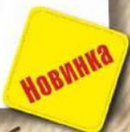
Лагман с телятиной 240 руб. 350/30 г