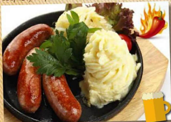
Мексиканские 520 руб. из говядины 160/150/100/30 г