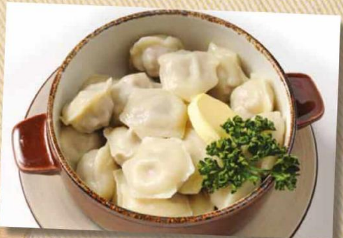
Пельмени домашние 260 руб. На Ваш выбор: отварные, жареные, в курином бульоне. 200/50 г