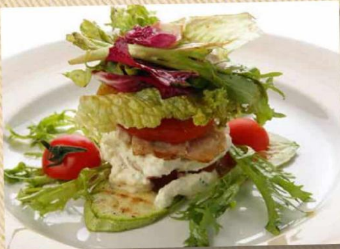
Теплый салат с куриным филе и соусом «Блю-чиз» 330 руб. Куриное филе, томаты, кабачок, листья салатов, соус «Блю-чиз». 220 г