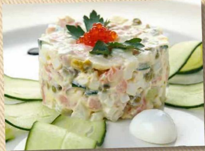
Оливье с копченым лососем и икрой 220 г 330 руб.