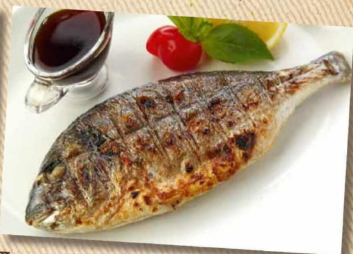
Дорадо с соусом наршараб 690 руб. 1шт/50/50 г