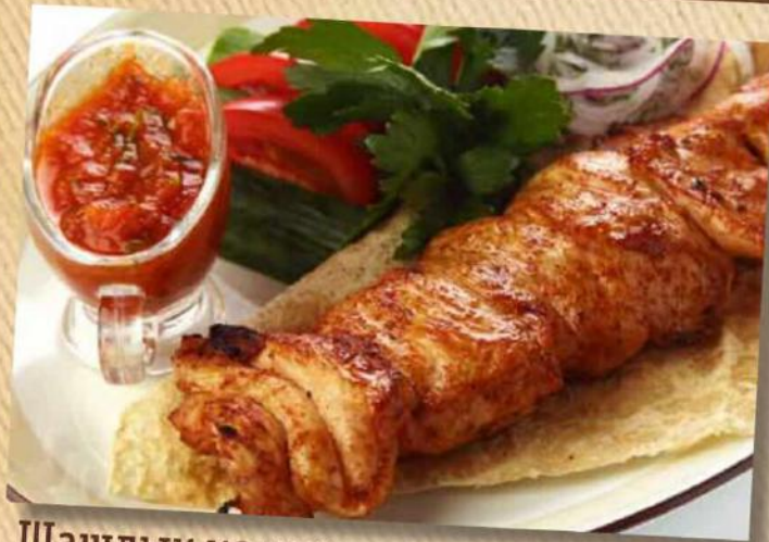
Шашлык из курицы 390 руб. Курица, лаваш, овощи, маринованный лук, соус «Сацибели». 180/150/50 г