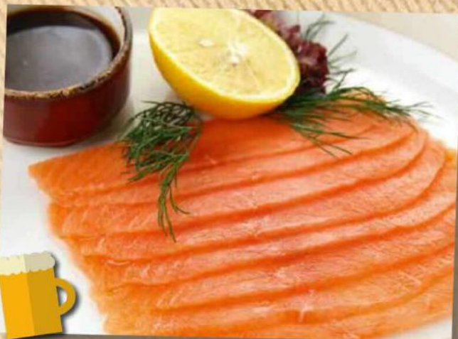
Семга слабосоленая 490 руб. с медово-горчичным соусом Семга слабой соли, соус медово-горчичный 100/30 г