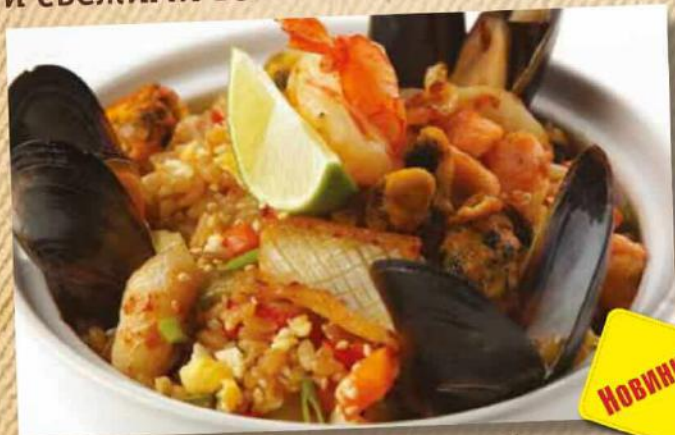
Рис с курицей 260 г 270 руб. Рис с морепродуктами 260 г 360 руб.