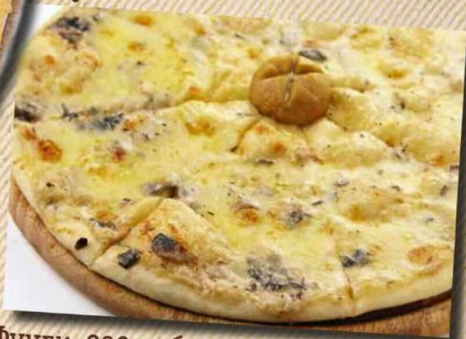
Фунги 290 руб. Грибы, сливочный соус, сыр. 360 г