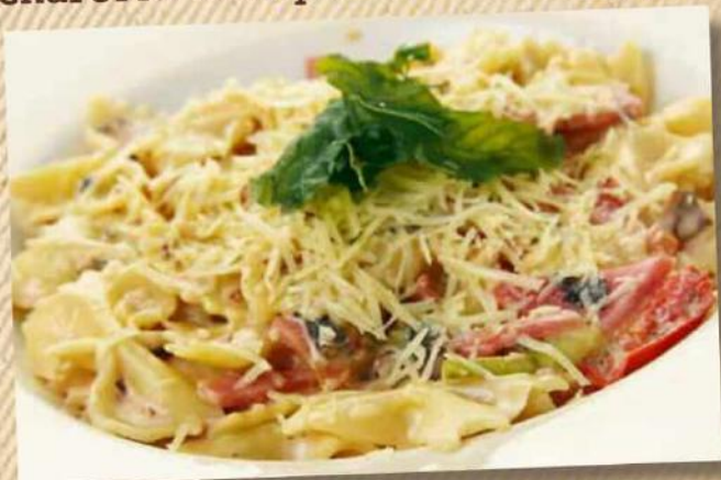
Фарфале с ветчиной и грибами 290 г 290 руб.