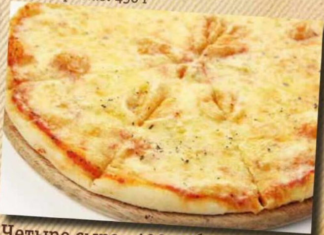
Четыре сыра 490 руб. 4 вида сыра, томатный соус. 280 г