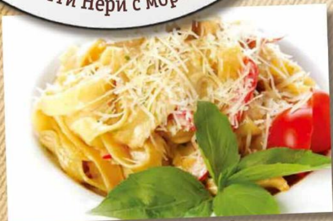
Феттуччини с куриным филе и овощами 250 г 390 руб.