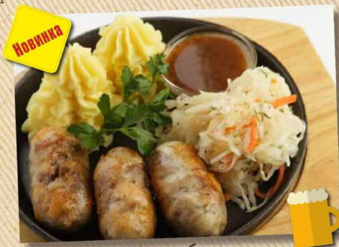
Домашние 520 руб. Куриные, собственного производства 180/150/100/30 г

колбаски подаются с картофельным пюре, капустой и медово-горчичным соусом