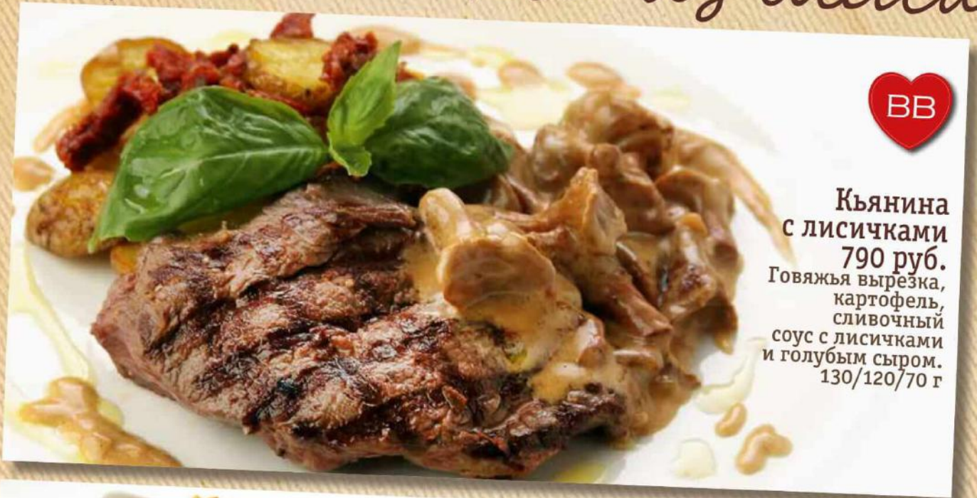
Кьянина с лисичками 790 руб. Говяжья вырезка, картофель, сливочный соус с лисичками и голубым сыром. 130/120/70 г