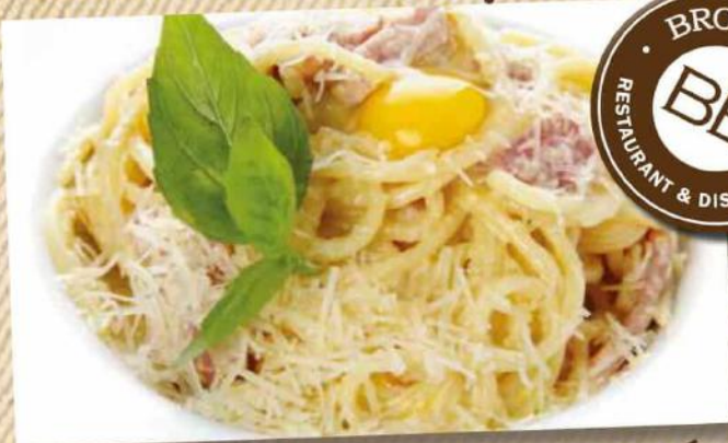
Спагетти Карбонара 250 г 390 руб.