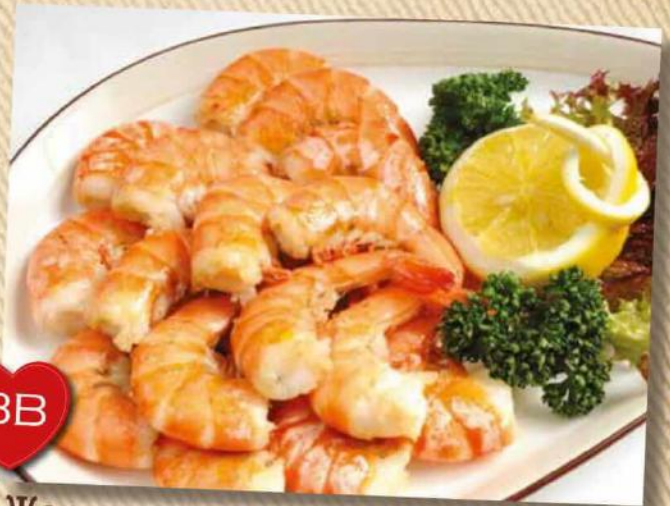
ВВ Жареные тигровые креветки с чесноком 200 г 990 руб.