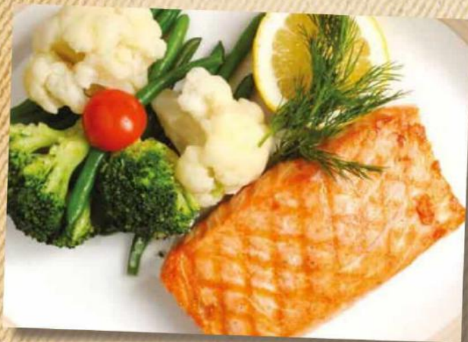
Стейк из лосося с брокколи и цветной капустой 890 руб.