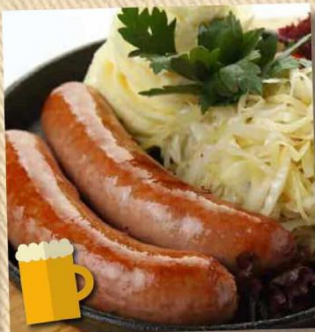
Европейские 520 руб. из говядины 180/150/100/30 г