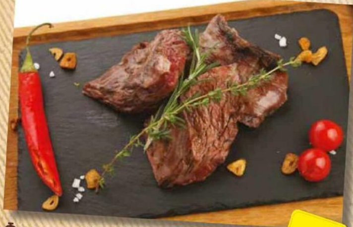
Флэп стейк 890 руб. Стейк из крестцовой части. Сочный, нежный с насыщенным ярким вкусом. 250/60 г