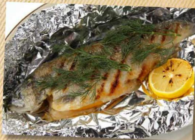
Форель радужная запеченная в фольге 1шт/50 г 540 руб.