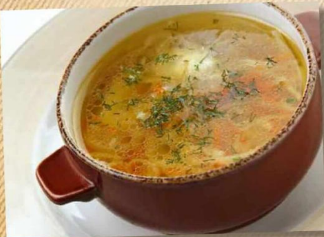
Лапша куриная 190 руб. 300 г