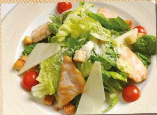
Цезарь с курицей 250 г 390 руб. Цезарь с креветками 225 г 680 руб.