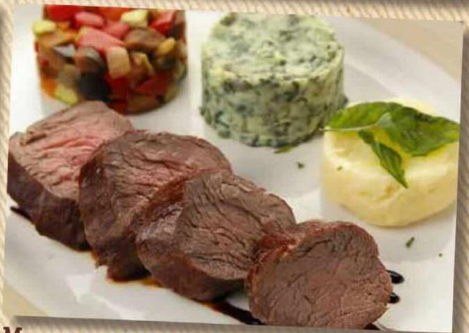
Медальоны из вырезки телянка с картофелем и овощным рататюем 790 руб. Телячья вырезка с грибным соусом, картофельным пюре и овощами 130/190/80 г