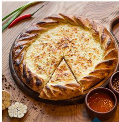
ХАЧАПУРИ ОТ ТЕТИ ЭЛИСО AUNT ALISO'S KHACHAPURI