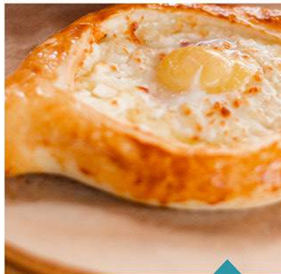
ХАЧАПУРИ ПО-АДЖАРСКИ ADJARULI KHACHAPURI