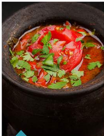
ЧАНАХИ ИЗ БАРАНИНЫ MUTTON CHANAKHI