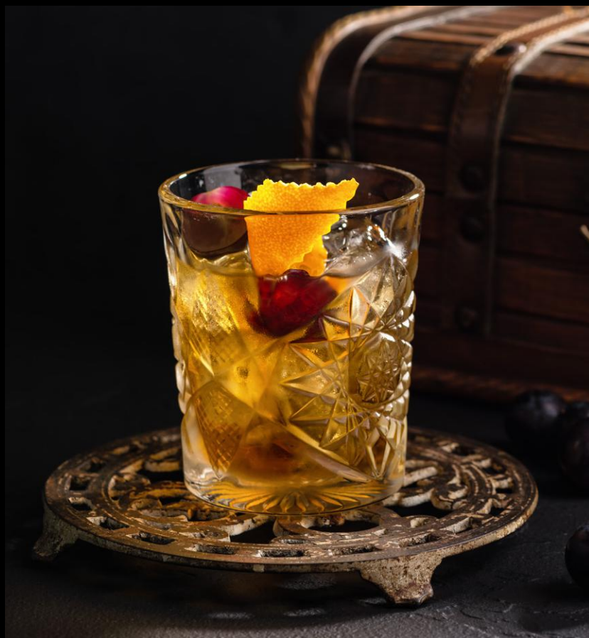
РОМ ФЕШН • RUM FASHIONED | 280 мл

Ром пряный, сладкий херес, ангостура биттер // 460