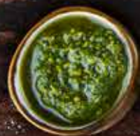
Соус песто 60г 185 руб.