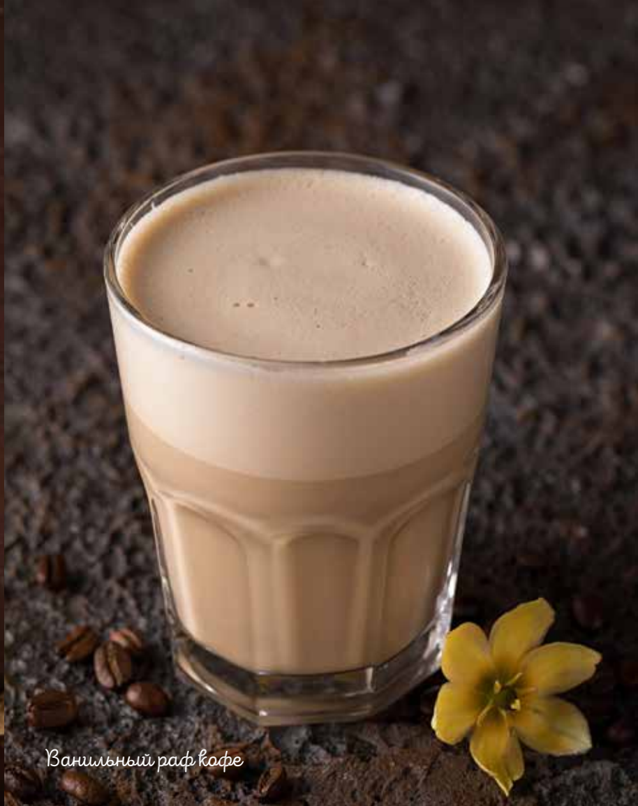
Ванильный раф кофе