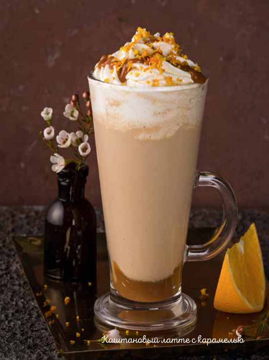
Каштановый латте с карамелью