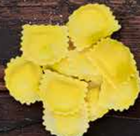
Равиоли с моцареллой