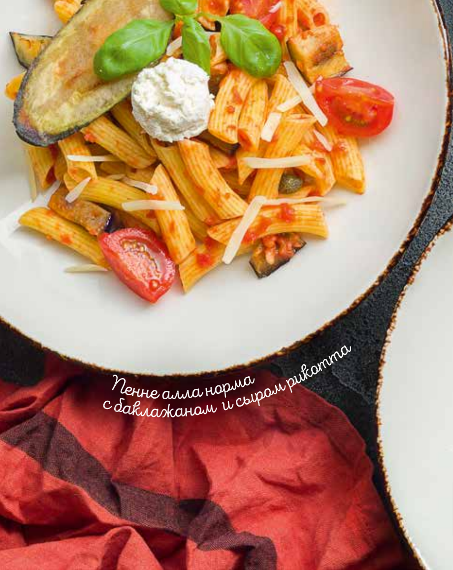
Пенне алла норма с баклажаном и сыром рикотта