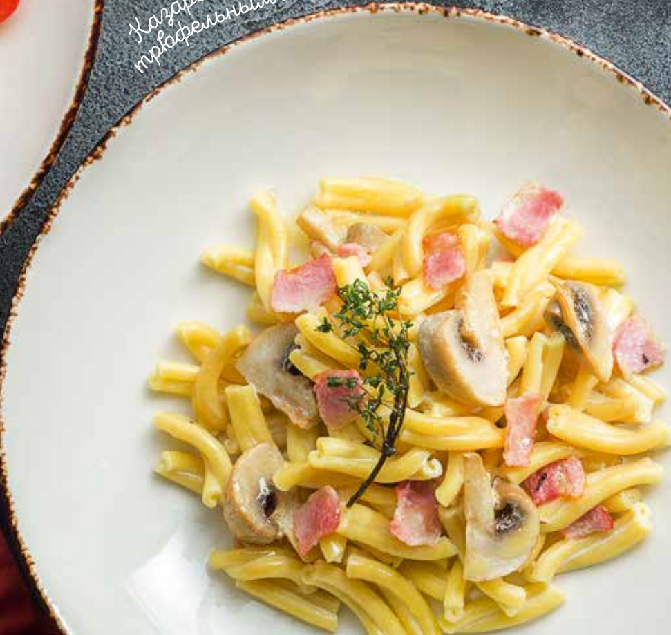
Казаречче с шампиньонами, трюфельным маслом и беконом