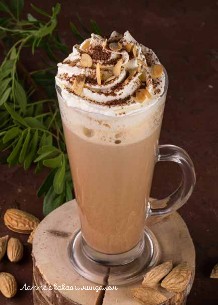
Латте с какао и миндалем