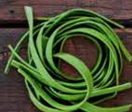
Феттучини со шпинатом