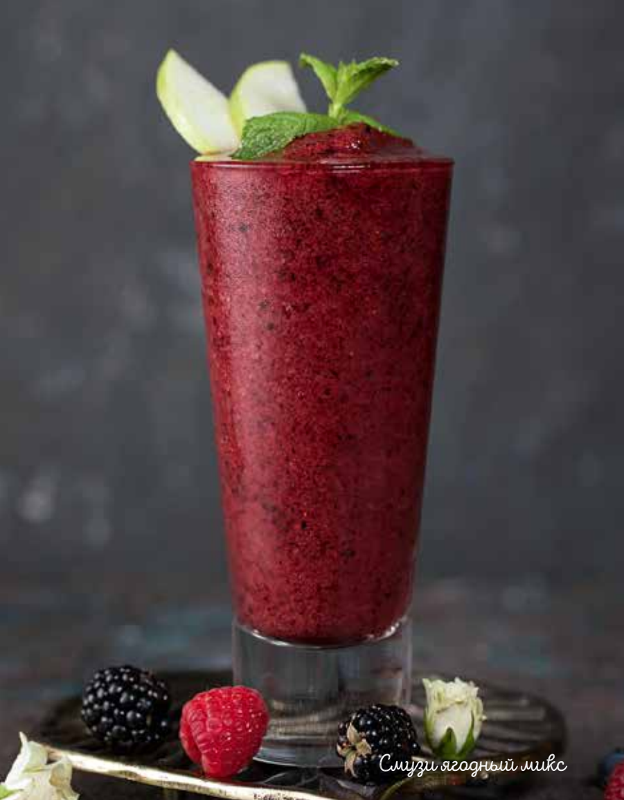
Смузи ягодный микс