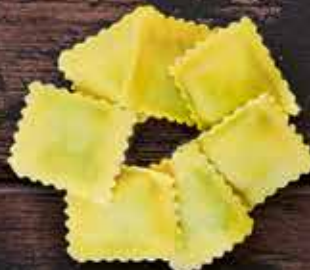
Равиоли с рикоттой и шпинатом