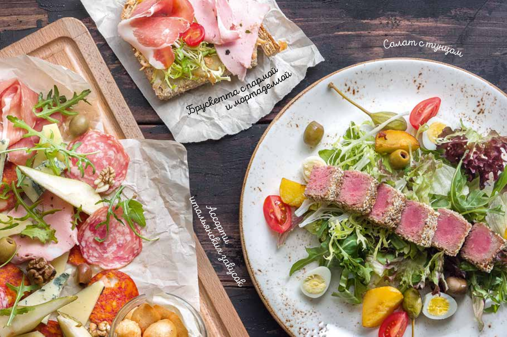
Салат с тунцом