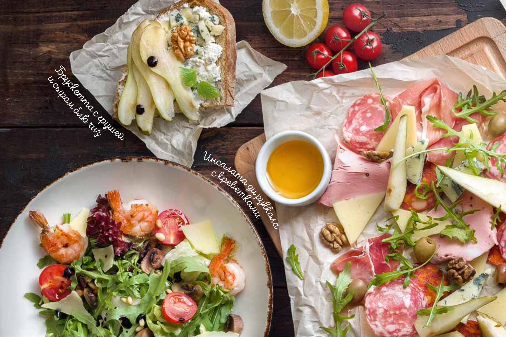
Брускетта с грушей и сыром блю чиз