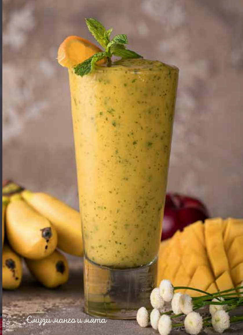
Смузи манго и мята