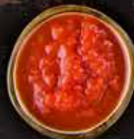
Томатный соус 150г 199 руб.