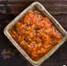
Соус Болоньезе 150г 239 руб.