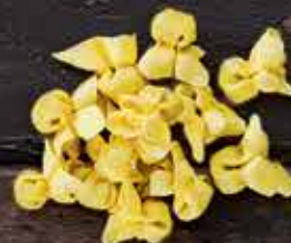
Тортеллини с мясом